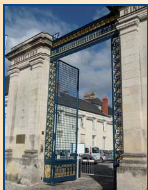
Grilles de la préfecture de Tours