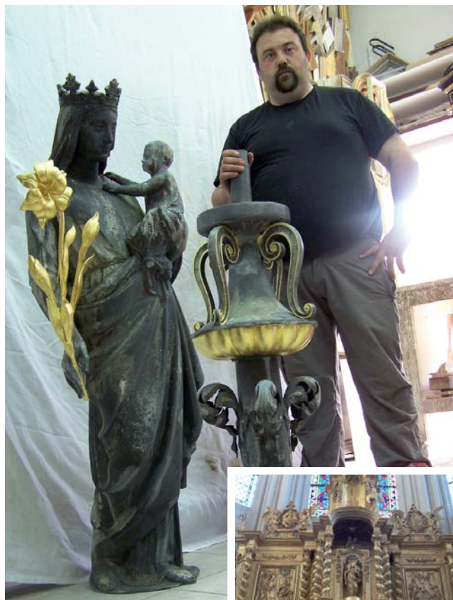
Retable de l'église des Roches Lévêque

Mais ses clients les plus importants sont les monuments historiques et les musées nationaux et internationaux puisque M. DAVID rayonne un peu partout en Europe (Hongrie, Turquie) et même au-delà puisqu'il a des commandes venues de Russie et des USA. Il faut dire que l'habilitation "Agrément officiel de la direction nationale des musées de France" (ils sont seulement 15 sur 170 doreurs à l'être en France) lui a permis de remporter de gros marchés de restauration. Parmi les réalisations de Mr DAVID on pourra citer la Chapelle royale de Dreux, la restauration des 200 cadres du musée Fabre de Montpellier, le Parlement de