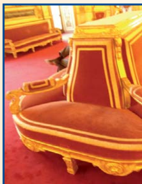
Mobilier du Sénat